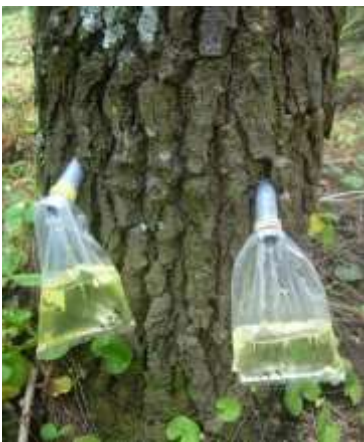
Gambar 1. Getah dalam kantong yang tidak bercampur kotoran

Hasil analisis varians menunjukkan perbedaan yang sangat signifikan ( p=0,001 ) di antara kelas umur pinus ras lahan Jawa terhadap produksi getah (Lampiran 1). Hasil uji lanjut orthogonal polynomial menunjukkan respons bersifat kuadratik ( p=0,09 ) antara produksi getah dengan kelas umur. Respons yang bersifat kuadratik ini ditunjukkan oleh peningkatan produksi getah dari kelas umur III (36,5 g) meningkat pada kelas umur IV (62,9 g). Produksi getah pada kelas umur V sebesar 24,61 g cenderung menurun dan produksi getah pada kelas umur VI sebesar 38,3 g. Kecenderungan peningkatan dan penurunan produksi getah disajikan pada Gambar 2.